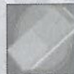
Bombe niveau 1